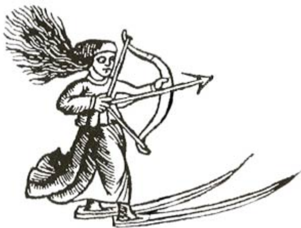
lapońska kobieta albo bogini na nartach Olaus Magnus (1553)